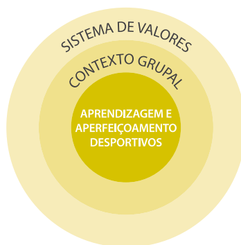
FIGURA 1 - A pedagogia aplicada em contexto desportivo visa a eficácia do(a) treinador(a) nos processos de ensino e aperfeiçoamento dos praticantes, tendo em atenção que estes processos são condicionados pelas inter-relações que se estabelecem no contexto grupal em que decorrem e pelo sistema de valores (filosofia) dos agentes que os organizam e dirigem.