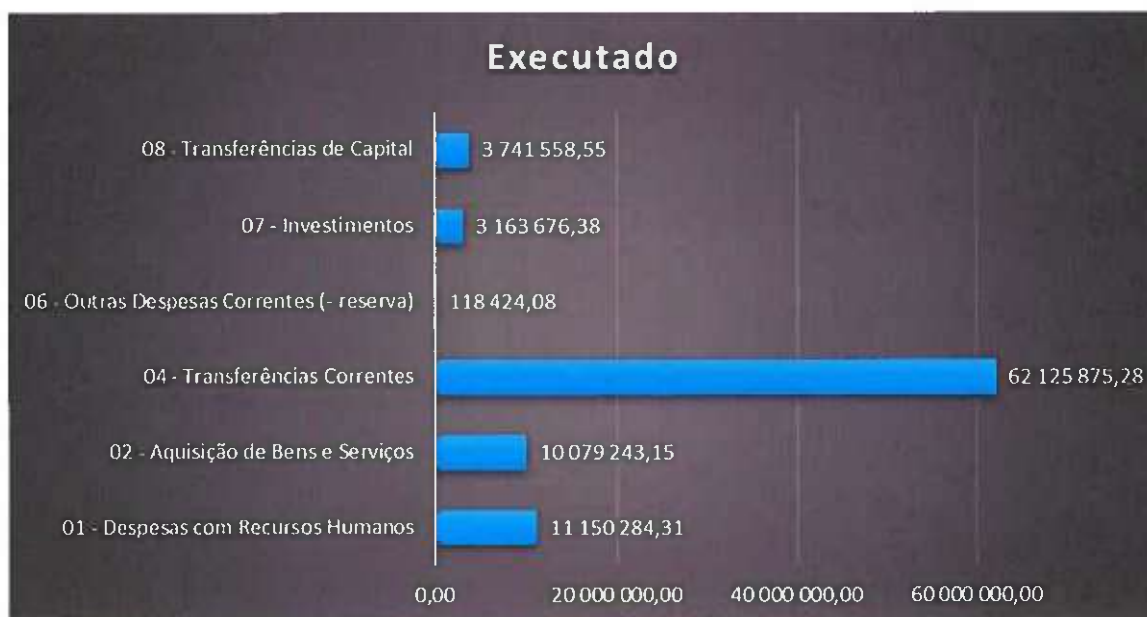
Quadro 4. Influência da tipologia de despesa na execução do orçamento