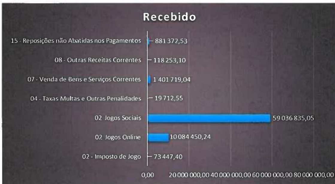
Gráfico 2. Receita própria arrecadada

Da análise à tipologia da Receita Própria arrecadada, verifica-se que o Instituto tem uma dependência dos Jogos Sociais e dos Jogos Online de 97% do seu total. Ainda devido à pandemia, verifica-se uma quebra das receitas provenientes do jogo do Bingo (imposto de jogo) e das Vendas de Bens e Serviços representando 0,10% e 1,96% respetivamente.